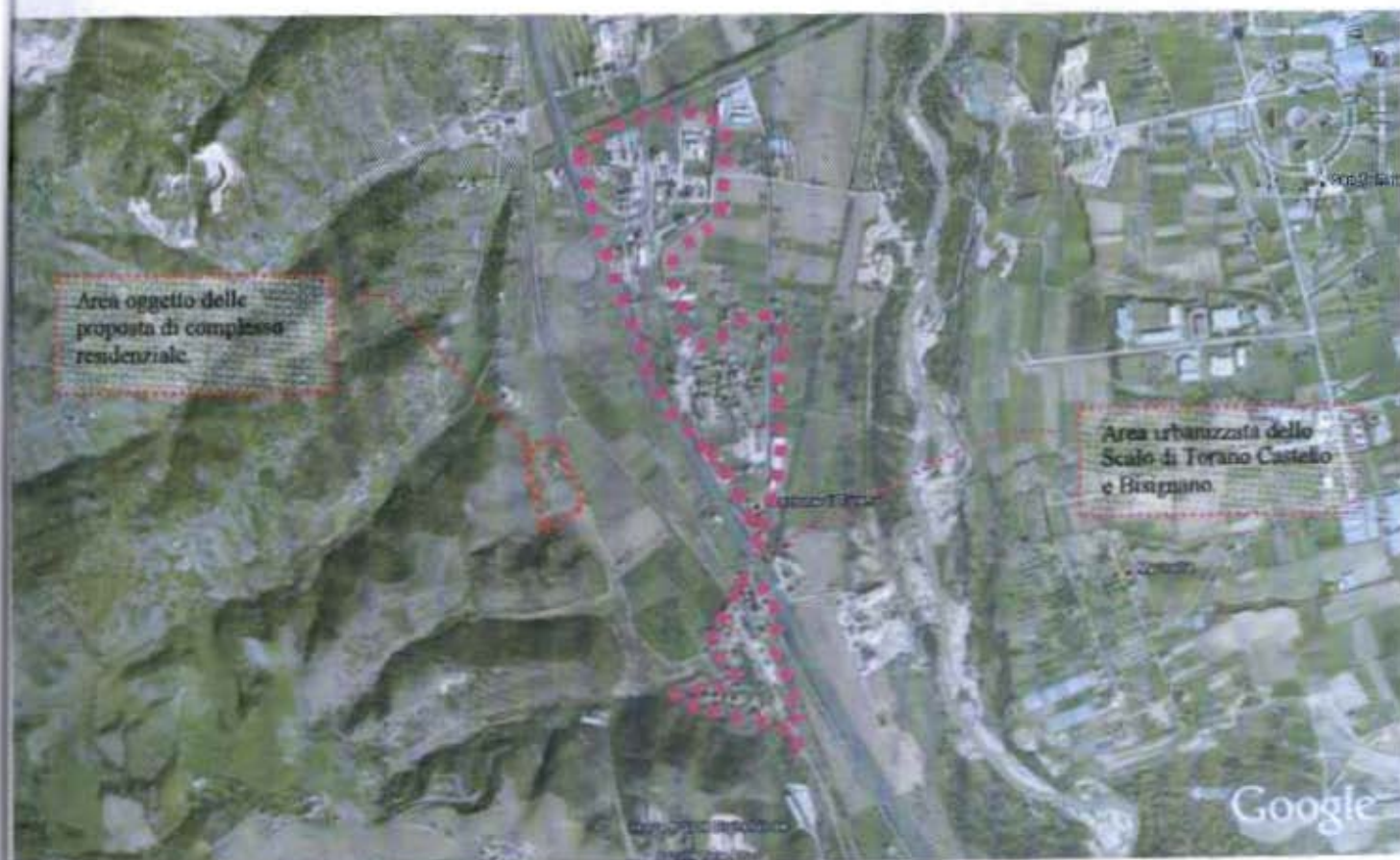
Figura n°1)- Foto aerea con indicazione della zona oggetto di proposta

Lo scrivente chiede, inoltre, che per il prosieguo delle attività di partecipazione legate al laboratorio urbano, siano contattati i tecnici incaricati alla progettazione, ossia, Ing. Francesco Stamile e Arch. Virgilio Lento (Studio di Architettura ed Ingegneria Arch. Virgilio Lento - Ing. Francesco Stamile, Via Nazionale Palazzo Edil 5, tel. e fax 0984 506291)