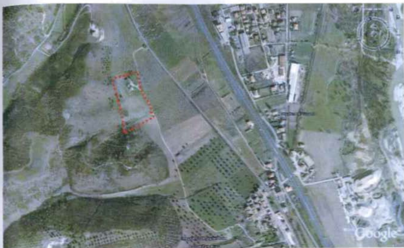
Figura n°2- Foto aerea con indicazione della zona oggetto di proposta