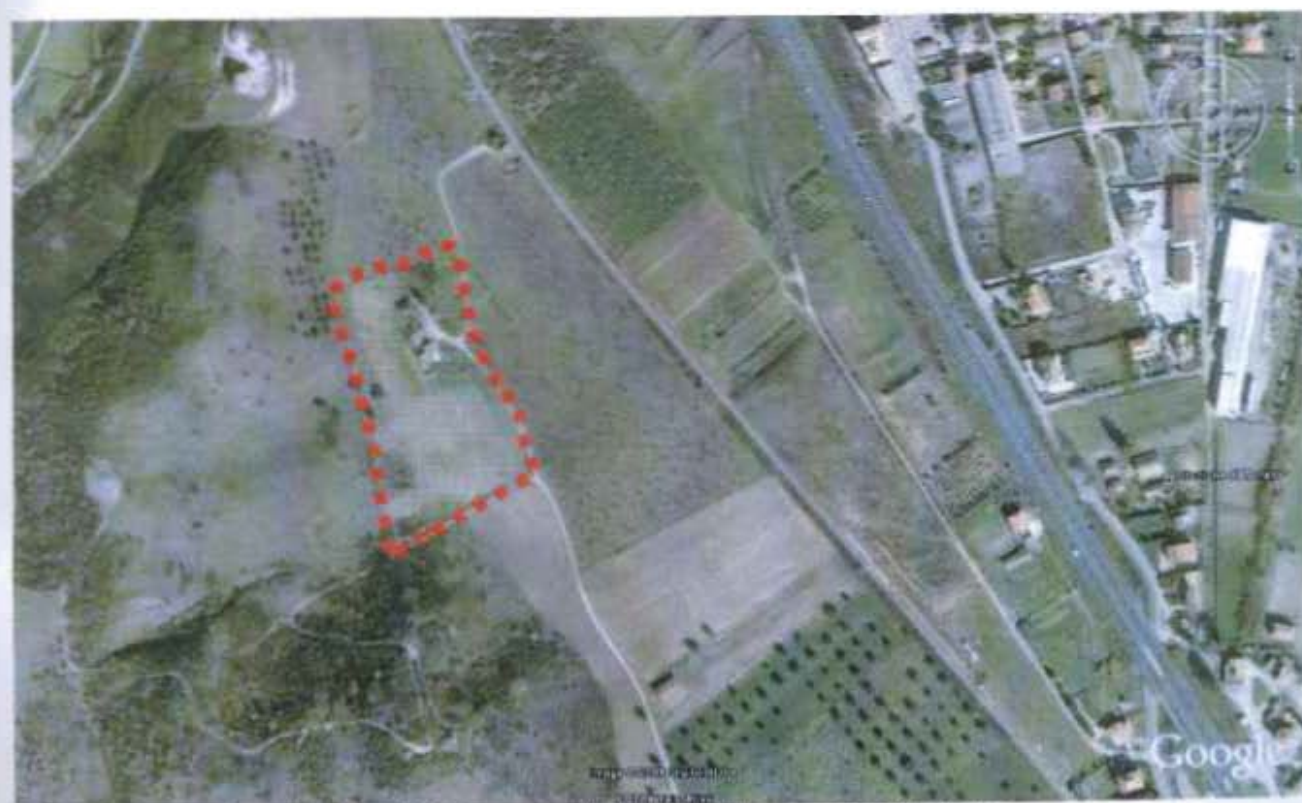
Figura n°3- Foto aerea con indicazione della zona oggetto di proposta