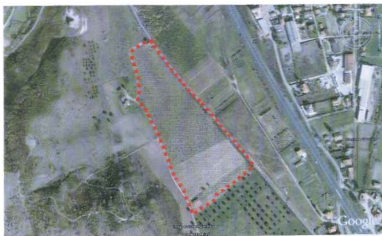
Figura n°3- Foto aerea con indicazione della zona oggetto di proposta