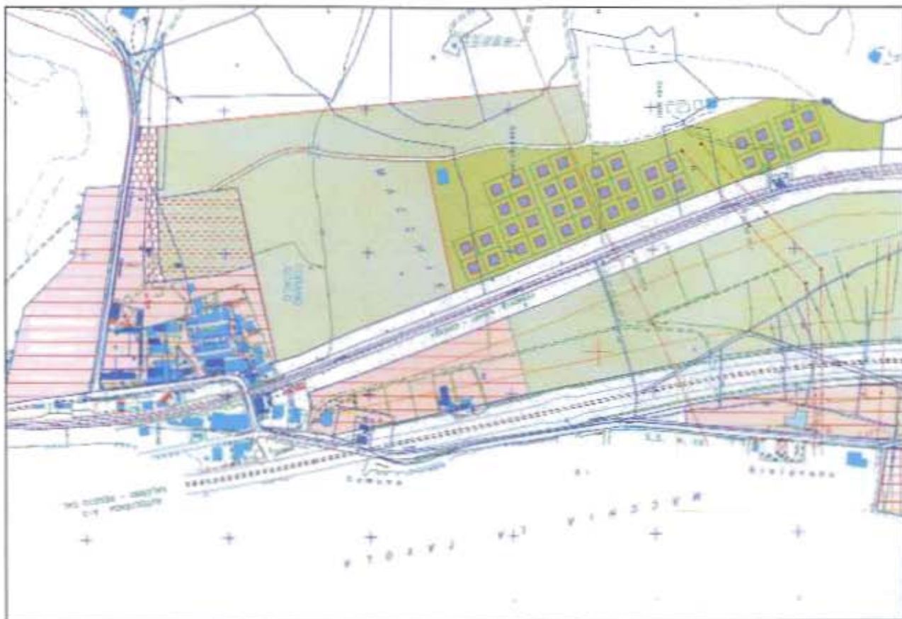
Figura n°4- Foto aerea con indicazione della zona oggetto di proposta