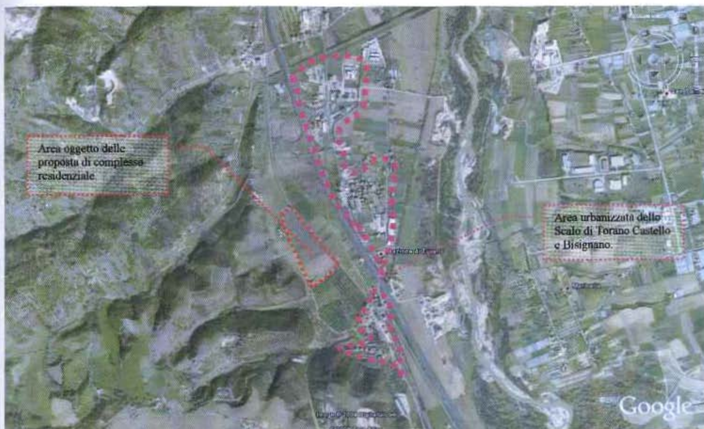
Figura n°1- Foto aerea con indicazione della zona oggetto di proposta