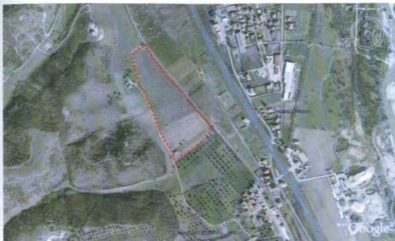
Figura n°2- Foto aerea con indicazione della zona oggetto di proposta