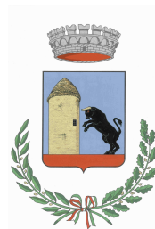
Comune di Torano Castello