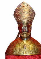
Parrocchia San Biagio V. e M.